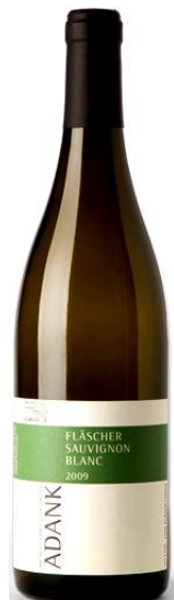
Fläscher Sauvignon Blanc