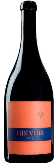
Pinot Noir Lux