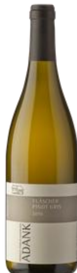
Fläscher Pinot Gris