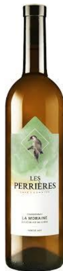
Chardonnay Fût de Chêne