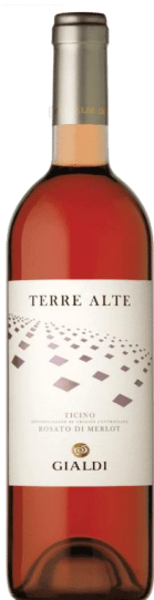
Terre Alte Rosato