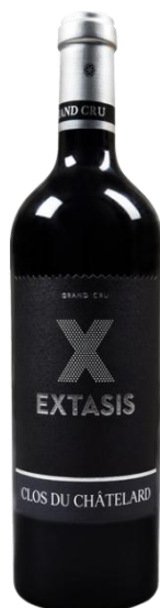
Extasis Clos du Châtelard