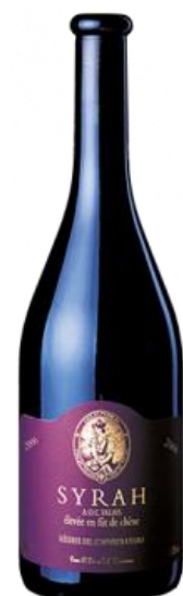
Syrah fût de Chêne