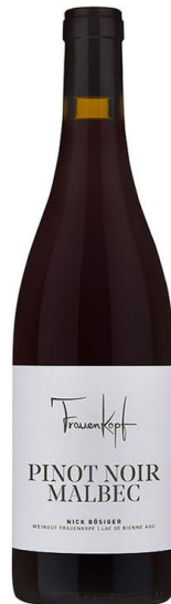
Pinot Noir Malbec