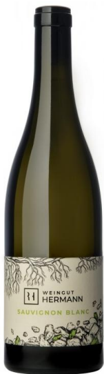
Fläscher Sauvignon Blanc