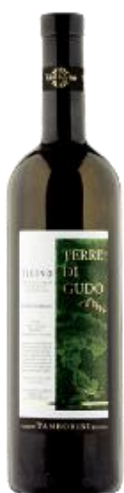
Terre di Gudo