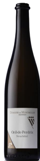
Oeil de Perdrix