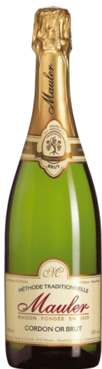
Mauler Cordon or Brut

Ein friedliches und idyllisches Tal, ein altes Benediktinerkloster, in dem die gregorianischen Gesänge bis heute nachzuhallen scheinen, geheimnisvolle Keller mit Jahrhunderte alten Gewölbe. In diesem aussergewöhnlichen Rahmen stellt die Familie Mauler seit 1829 mit Leidenschaft und hohem Traditionsbewusstsein ihre grossen Vins Mousseux her. Respekt vor einem jahrhunderte alten Handwerk. Die seit Beginn angewendete traditionelle Methode («Méthode traditionnelle») erfordert komplexe Kenntnisse und unendlich viel Sorgfalt. Das Ritual ist stets das Gleiche: eine strenge Selektion der Reben und Trauben, die an den sonnigen Weinbergen des Neuenburger Sees gedeihen, eine subtile Assemblage nach der ersten Gärung, die zweite Gärung in der Flasche, dann die langsame Reifung in der Dunkelheit bei konstanter Temperatur, schliesslich das gleichmässige Rütteln der Flaschen, das Degorgieren und die Dosage, bevor die Flasche ihr endgültiges Festgewand erhält.