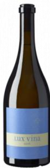
Petite Arvine Lux