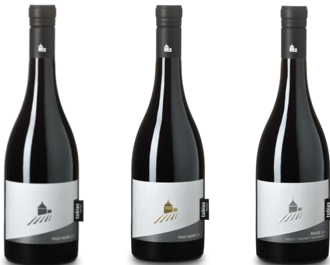
Pinot Noir G3