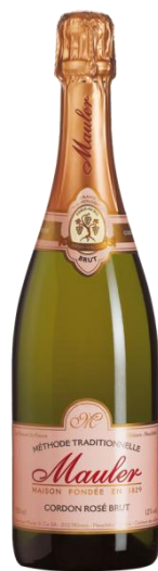
Mauler Cordon Rosé Brut