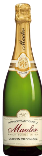
Mauler Cordon or demi Sec