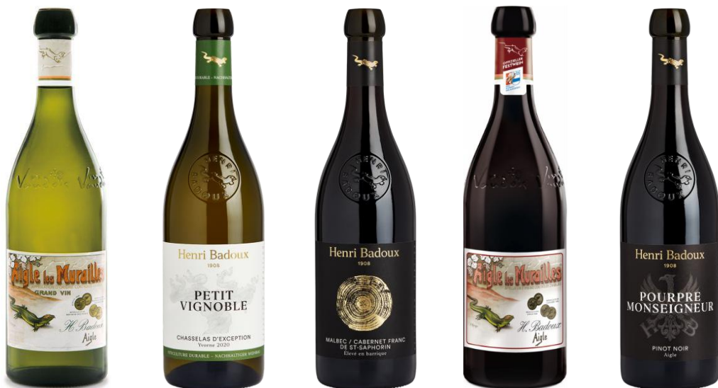
Aigle Les Murailles

Die waadtländischen Herkunftsbezeichnungen nach strengsten Qualitätsrichtlinien zur Geltung bringen, wird Priorität. Heute gehört die Henri Badoux SA zur Schenk Gruppe.