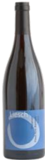
Pinot Noir Barrique