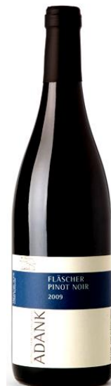
Fläscher Pinot Noir