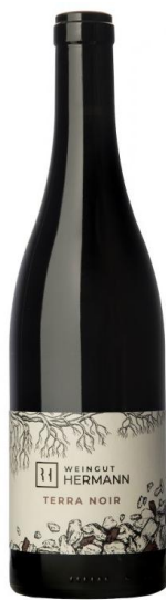
Fläscher Terra Noir