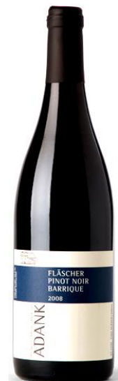
Fläscher Pinot Noir Barrique