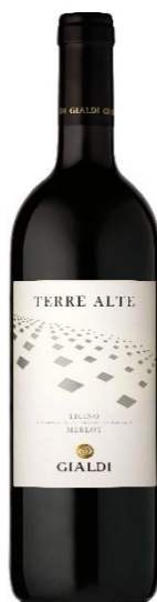
Terre Alte Rosso